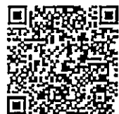
แบบรายงานฯ